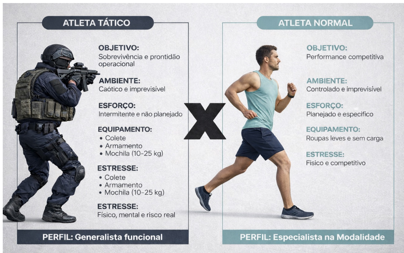
Figura 1 – Características gerais entre atleta tático e atleta normal (competitivo).