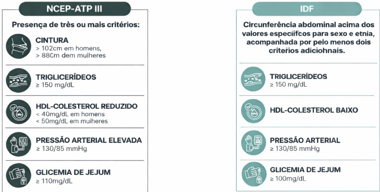
Figura 02 – Características para classificação da síndrome metabólica.